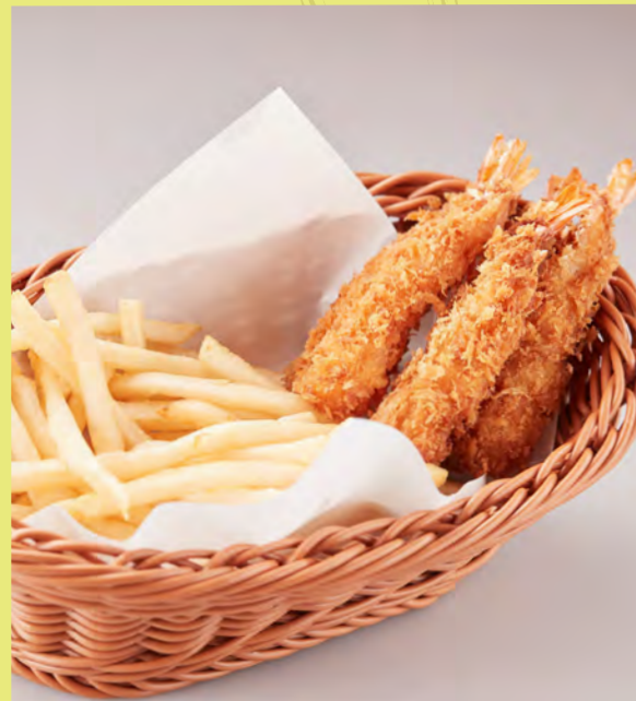
SHRIMP & CHIPS シュリンプ & チップス 蝦和薯片 새우와 칩스 ¥680 税込 ¥748