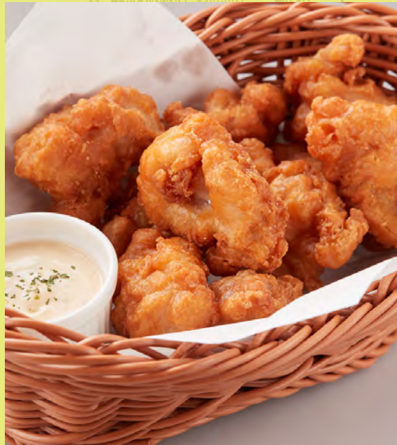
FRIED CHICKEN チキン唐揚げ 炸雞 후라이드 치킨 ¥580 税込 ¥638