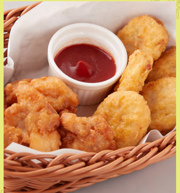
CHICKEN NUGGET & FRIED CHICKEN チキンナゲット & 唐揚げ 雞塊和炸雞 치킨 너겟과 후라이드 치킨 ¥680 税込 ¥748