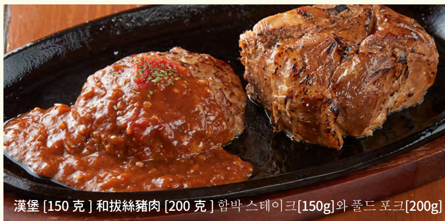
漢堡 [150 克] 和拔絲豬肉 [200 克] 함박 스테이크 [150g] 와 풀드 포크 [200g]