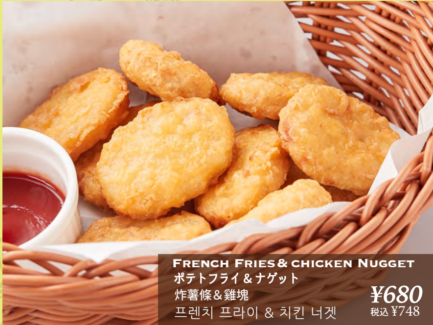
FRENCH FRIES & CHICKEN NUGGET ポテトフライ & ナゲット 炸薯條 & 雞塊 프렌치 프라이 & 치킨 너겟 ¥680 税込 ¥748