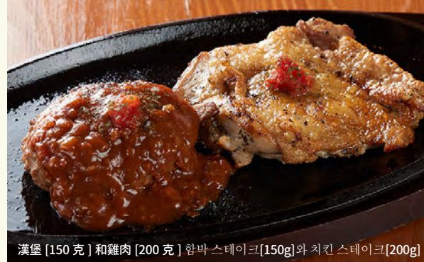
漢堡 [150 克] 和雞肉 [200 克] 함박 스테이크 [150g] 와 치킨 스테이크 [200g]