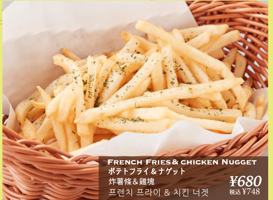
FRENCH FRIES & CHICKEN NUGGET ポテトフライ & ナゲット 炸薯條 & 雞塊 프렌치 프라이 & 치킨 너겟 ¥680 税込 ¥748