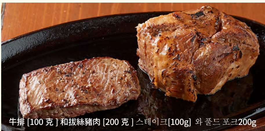
牛排 [100 克] 和拔絲豬肉 [200 克] 스테이크 [100g] 와 풀드 포크 [200g]