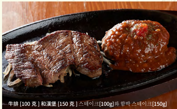
牛排 [100 克] 和漢堡 [150 克] 스테이크 [100g] 와 함박 스테이크 [150g]