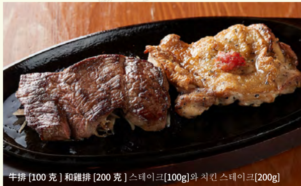
牛排 [100 克] 和雞排 [200 克] 스테이크 [100g] 와 치킨 스테이크 [200g]